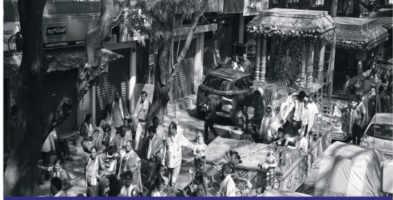
ರಥಯಾತ್ರೆಯಲ್ಲಿ ಭಾಗವಹಿಸಿದ್ದ ಜನ ಸಮೂಹ